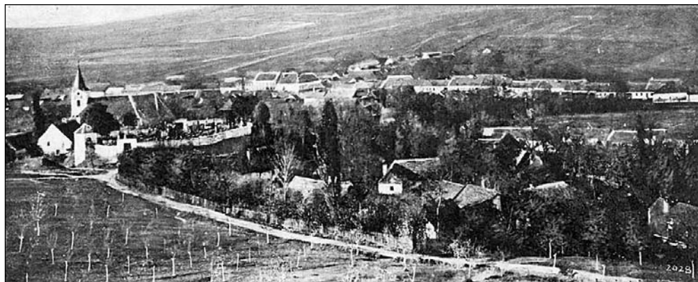
Knínice rok 1943.

V prosinci uplyne 215. výročí bitvy u Slavkova. Jak se tato krvavá událost zapsala do jinak poklidného života zdejších obyvatel, si povíme v letošním posledním vydání Zpravodaje.