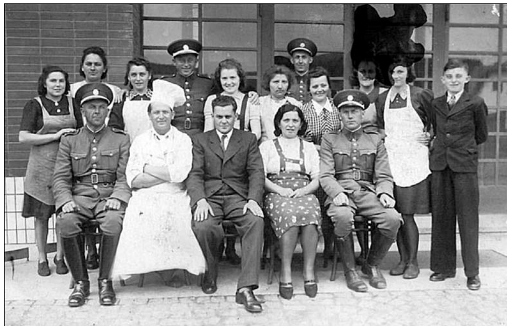
Zaměstnanci německého mládežnického tábora před školou v Kninčích. Asi r. 1943.